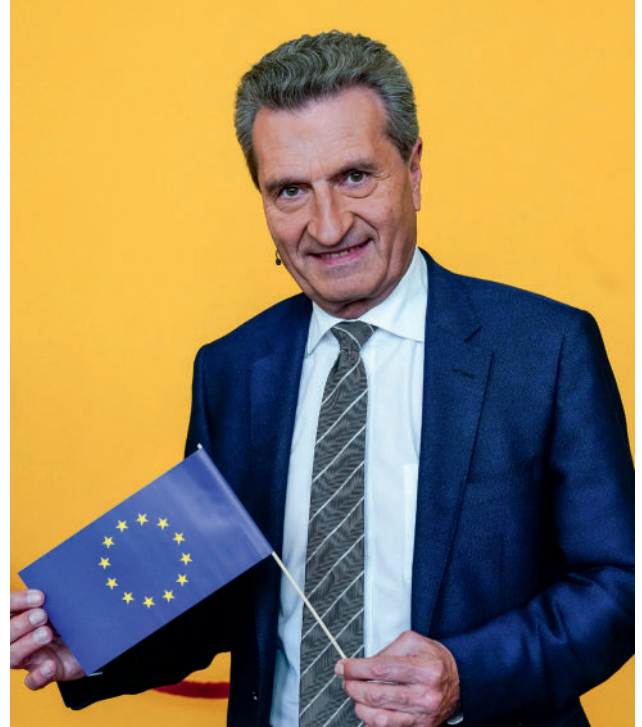
Der Erfinder der EU-Plastikabgabe: Günther Oettinger, EU-Haushaltskommissar von 2017 bis 2019.

Die EU-Plastikabgabe ist lediglich eine Methode zur Berechnung des Beitrags der Mitgliedstaaten an die EU. Sinkt sie, steigt nach dem Gesamtdeckungsprinzip die so genannte Restfinanzierung.