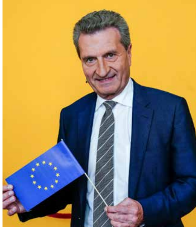
Der Erfinder der EU-Plastikabgabe: Günther Oettinger, EU-Haushaltskommissar von 2017 bis 2019.

Die EU-Plastikabgabe ist lediglich eine Methode zur Berechnung des Beitrags der Mitgliedstaaten an die EU. Sinkt sie, steigt nach dem Gesamtdeckungsprinzip die so genannte Restfinanzierung.